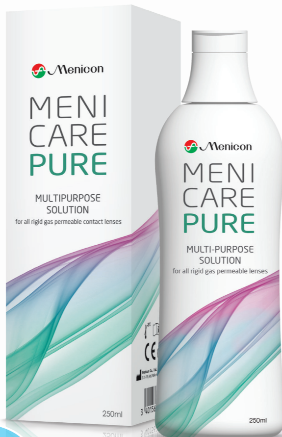
MENICARE PURE 250 ml + posodica za leče

Pred prvo uporabo pokrovček obrnite v smeri urinega kazalca