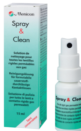
Sprej 15ml brez konzervansov

4 korak: Pred vstavitvijo kontaktnih leč predhodno sperite z MENICARE PURE. Kontaktne leče nato lahko nosite. Preostanek raztopine iz posodice za leče zavržite.